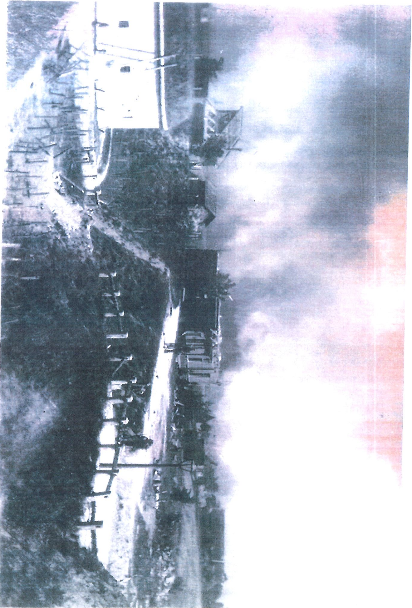
Fort II Panemurhōco - 1891